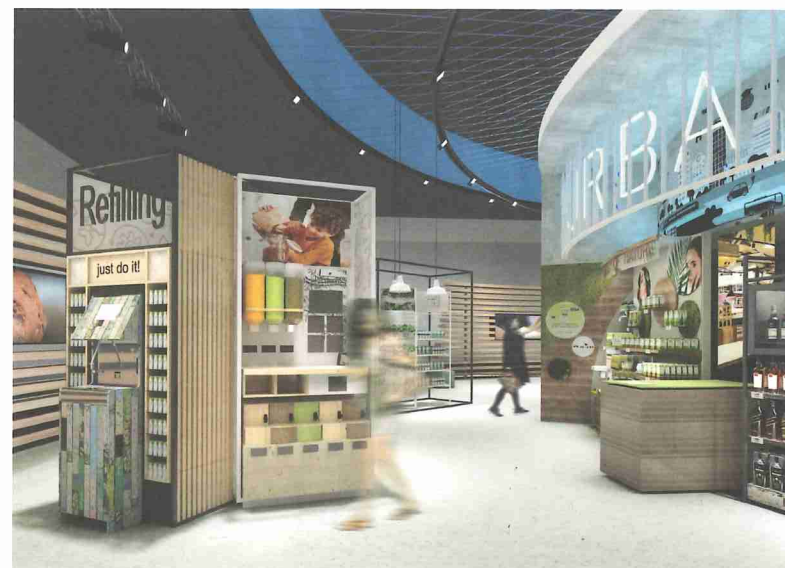
Der Rundgang durch den Messestand von umdasch beeindruckt mit Innovation und Inspiration. Entdecken Sie mit einer Inszenierung, die sämtliche Register der analogen und digitalen Kommunikation zieht, wie Sie Kunden zu Fans Ihrer Marke machen können.

„Persönlich freue ich mich auf die vielen innovativen Use-Cases, die unseren Besuchern zeigen, dass digitale Lösungen spannend und nutzenstiftend am Point of Experience integriert werden können.“