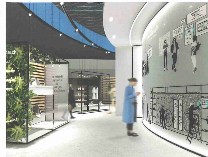
Die Erlebniswelt der Store Makers: Entdecken Sie spielerisch, welche Möglichkeiten interaktive Inszenierungen bieten.

„Ich bin gespannt auf die interaktive Wand, an der Besucher unsere Retail-Ideen mit allen Sinnen erfassen können. Außerdem laufen bei uns schon die Wetten, wie viele Posts unser Instagram-Hotspot während der fünf Tage bekommt ...“